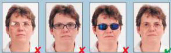
odblijesak s naočala

Osoba na fotografiji mora gledati izravno u kameru. Oči moraju biti otvorene i jasno vidljive, te vodoravne s x osi. Oči, nos i usta ne smiju biti pokriveni kosom.