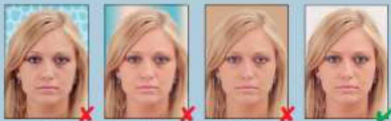
pozadina s uzorkom