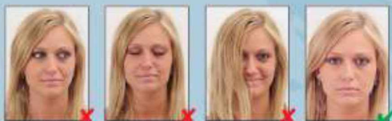
pogled u stranu

Fotografija treba osobu prikazivati s neutralnim izrazom lica i zatvorenih usta na frontalnoj snimci. Nije dopuštena klasična poza za profil (poluprofil, od kamere okrenuta ramena).